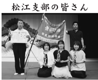
松江支部の皆さん

四年ぶりに開催されました「安来節全国優勝大会」に於きまして、団体の部で優勝させて頂いたこと、本当にありがとうございます。松江支部にとりましては、平成十六年以来、十九年ぶりの優勝に感無量の思いに浸っています。これからも支部会員で精進し、頑張っていきたいと思います。