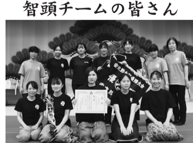
智頭チームの皆さん

前回は、お客様の声援と拍手に背中を押され、一人ひとりが笑顔で楽しく打つた結果が四連覇に繋がったのだと思います。本当にありがとうございます。今回も、引き続き課題を精進してまいります。